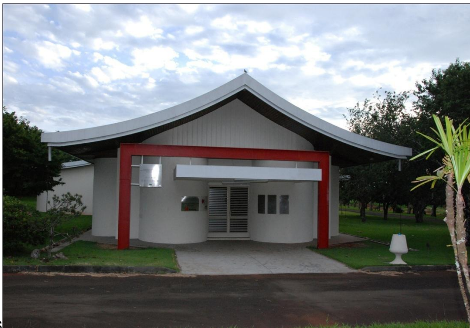
MUSEU JAPONÊS IGREJA MATRIZ

ATIVIDADES COMPLEMENTARES DE ESTUDO – COVID 19