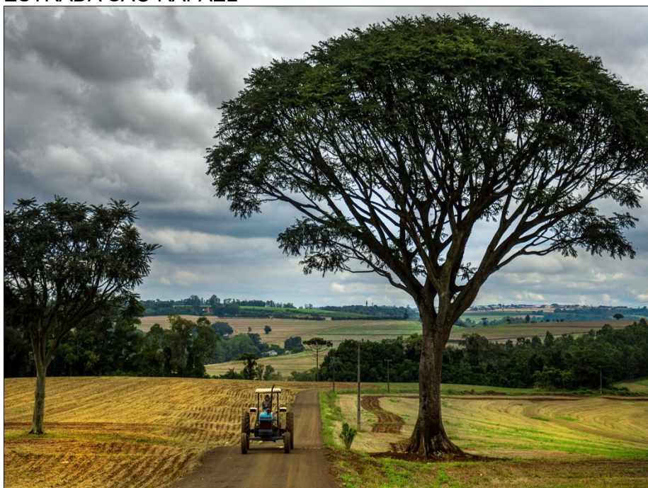
ESTRADA SÃO RAFAEL